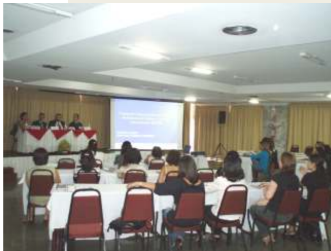
Módulo Teórico do 1º Curso de capacitação em Banco de Células e Tecidos Germinativos

Segundo a assessoria de imprensa da Anvisa, o objetivo da nova regulamentação sobre o funcionamento de bancos de células e tecidos germinativos (BCTG) é a garantia da qualidade e a segurança no processo de reprodução humana assistida.