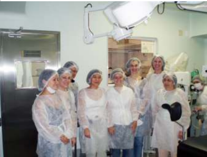
Técnicos da Anvisa durante treinamento na Androfert